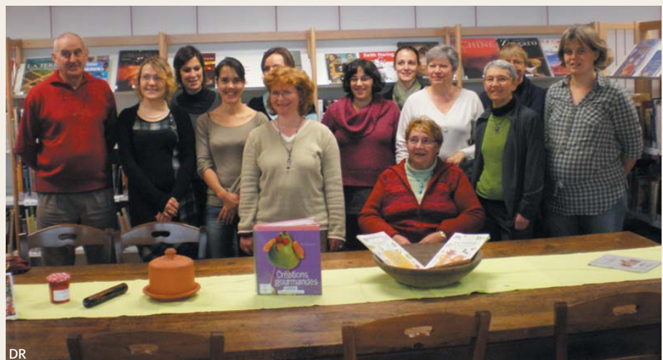
DR L'équipe de la bibliothèque municipale.

Depuis son ouverture toute récente au public, la bibliothèque compte déjà plus de 250 inscrits.