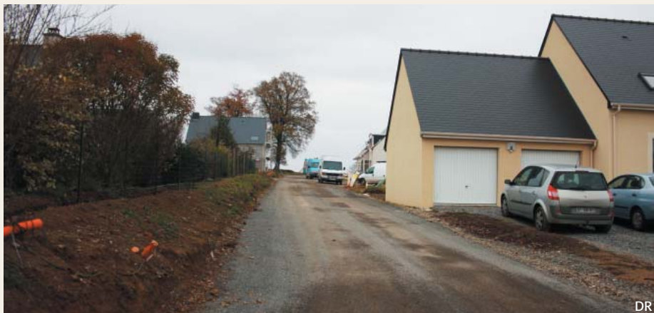
La rue desservant le nouveau lotissement Ker Joan.