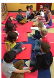
Séance de Yoga