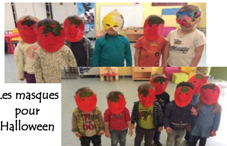
Les masques pour Halloween